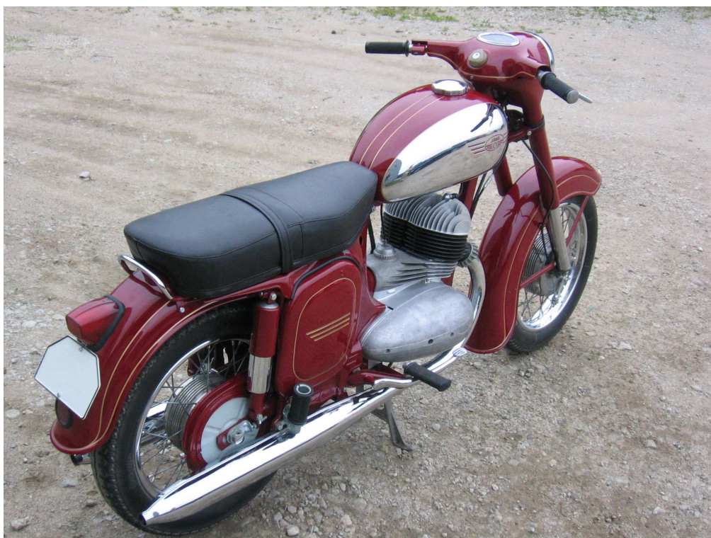
Diagonaalvaade tagaosale ja paremale küljele