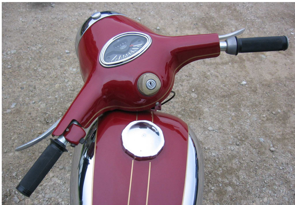
Vaade sõiduki juhtimisseadmetele