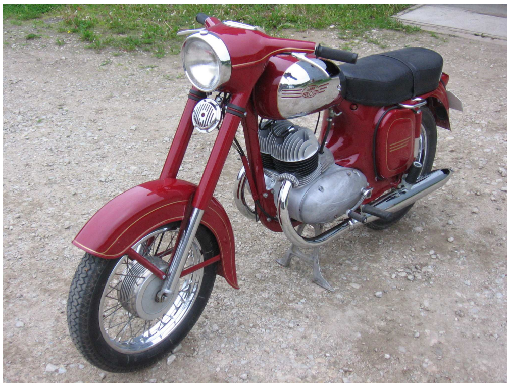
Diagonaalvaade esiosale ja vasakule küljele