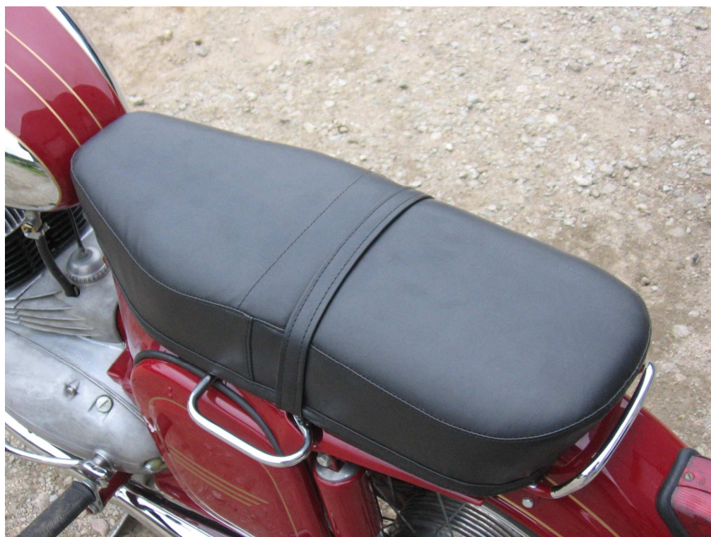
Vaade sõiduki istme(te)le