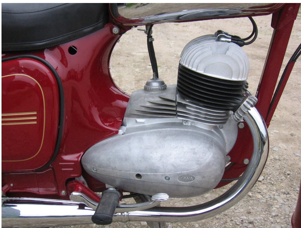
Vaade mootorile teiselt küljelt